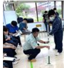
外部講師活用の様子