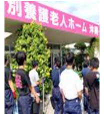
外部での清掃活動