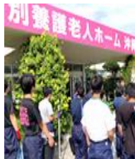
外部での清掃活動