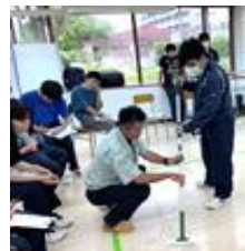
外部講師活用の様子