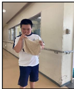
ゆいの郷【生活介護】