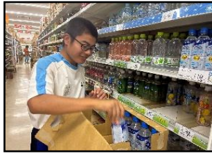
ダイレックス読谷店【企業】