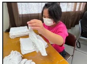
楽学喜サポートアチェンド音市場【B型】