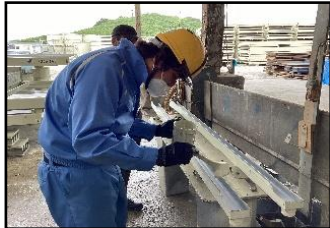
就労支援センター あっぷ【A型】