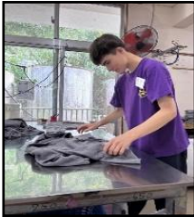
沖縄障害者福祉工場【A型】