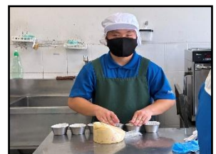
就労支援センターびゅあ食堂【B型】