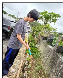
北中はごころ支援センター【生活介護】