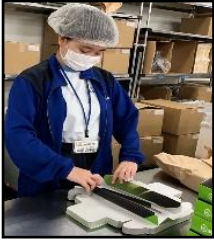
(株)御菓子御殿【企業】