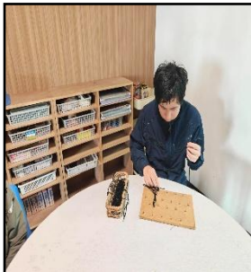
Do たかはら【生活介護】