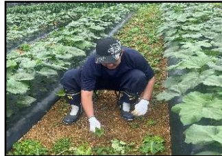
縁人 うるま事業所【A型】