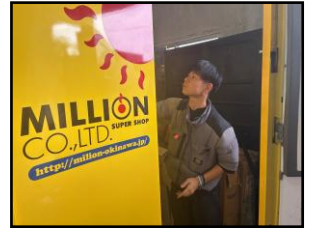
一般社団法人 かがやき【A型】