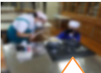
火を使うときは安全に気をつけて〜