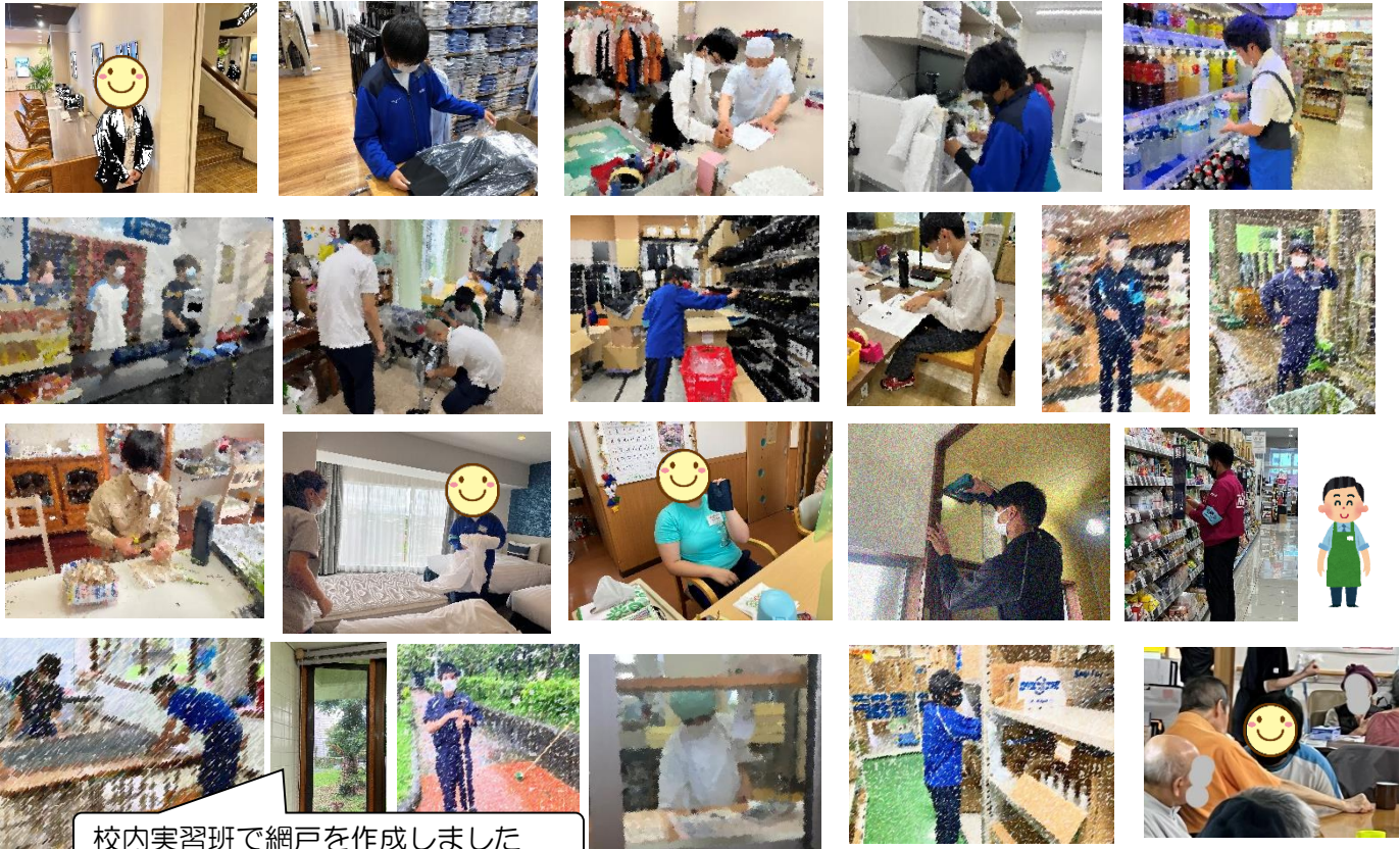
校内実習班で網戸を作成しました