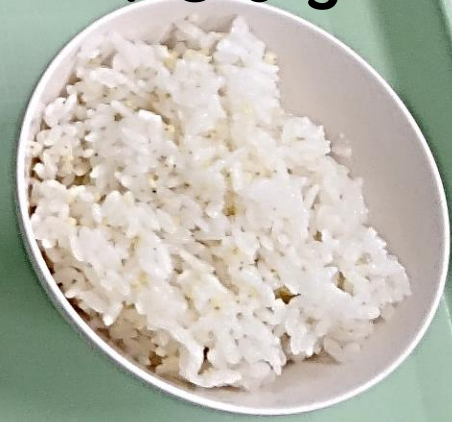
中学生.高校生 職員